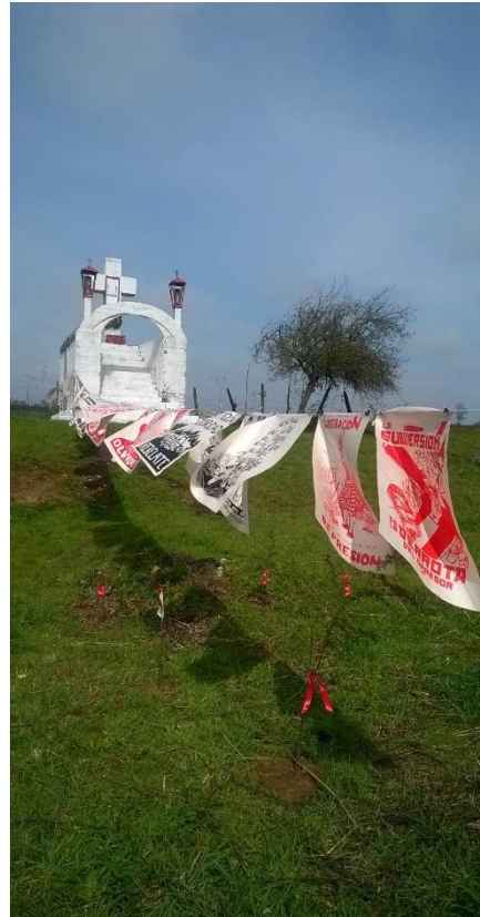
2. Instalación Puente Pilmaiquén