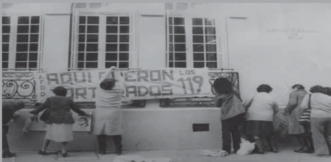
• Acciones de señalamiento de Londres 38 por agrupaciones de familiares de detenidos desaparecidos.