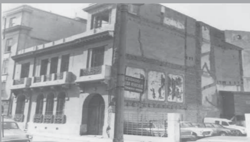
• Londres 38, años 70. Archivo de Londres 38, espacio de memorias.