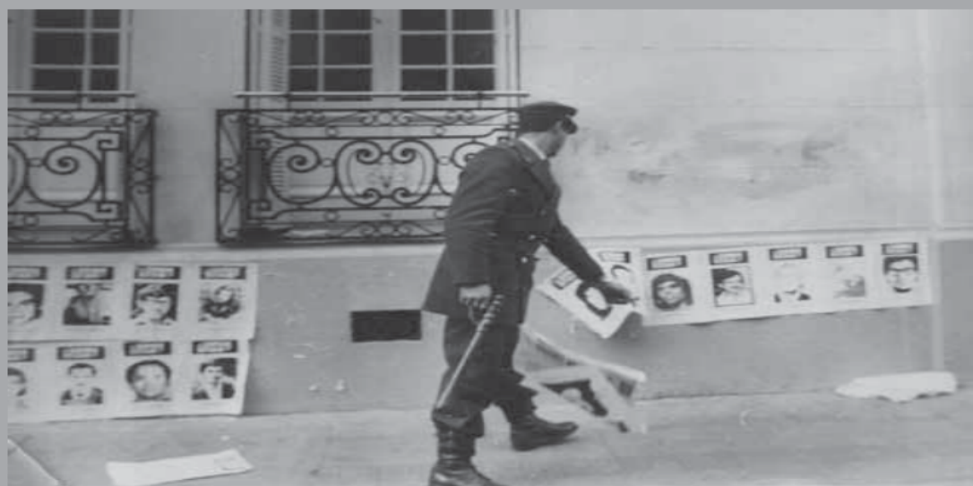
• Acciones de señalamiento de Londres 38 por agrupaciones de familiares de detenidos desaparecidos.