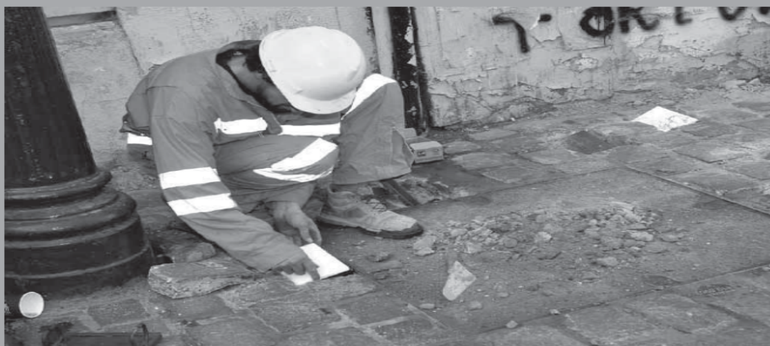
• Memorial Londres 38. Archivo de Londres 38, espacio de memorias.

3. Carta de la AFDD al presidente del Instituto O'Higiniano: