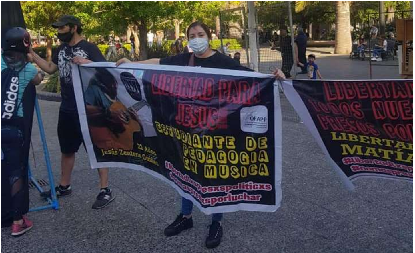
Manifestación en Plaza de Armas de Santiago realizada en la tarde del 21 de Octubre