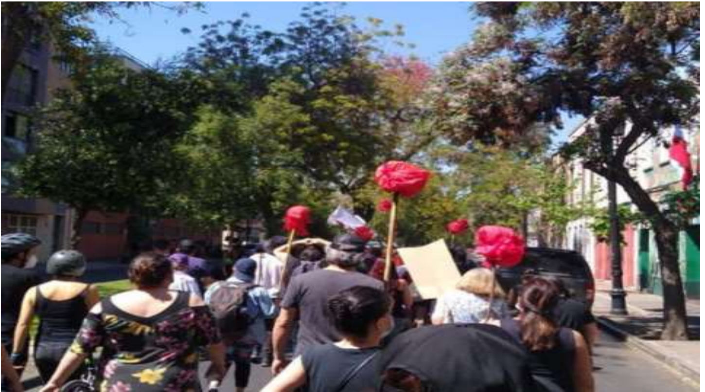
Plaza Yungay (Santiago)