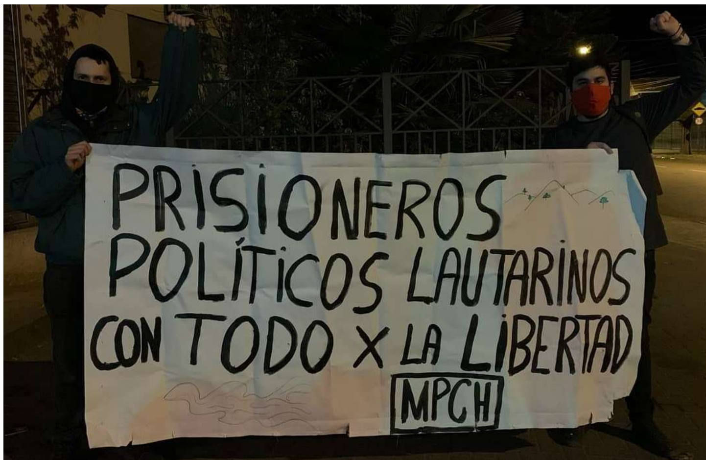
Saludo de los(as) compañeros(as) de la Asamblea Popular Chiway Antu, Región del Bío Bío

Como Guacoldas, reafirmamos el compromiso que hicimos desde nuestra rearticulación en Octubre pasado, que es el de luchar por la libertad de todos(as) los(as) prisioneros(as) políticos(as) de la Revuelta. Hoy estamos en un nuevo instante de la Batalla por la Libertad, en donde hay posibilidades de abrir paso a una solución política. Aquella solución creemos que es la Amnistía, que tiene que considerar la liberación inmediata y el desprocesamiento de todos(as) los(as) PP de la Revuelta, tanto en calidad de imputados o condenados, y que determine el cese a la persecución política en Chile.