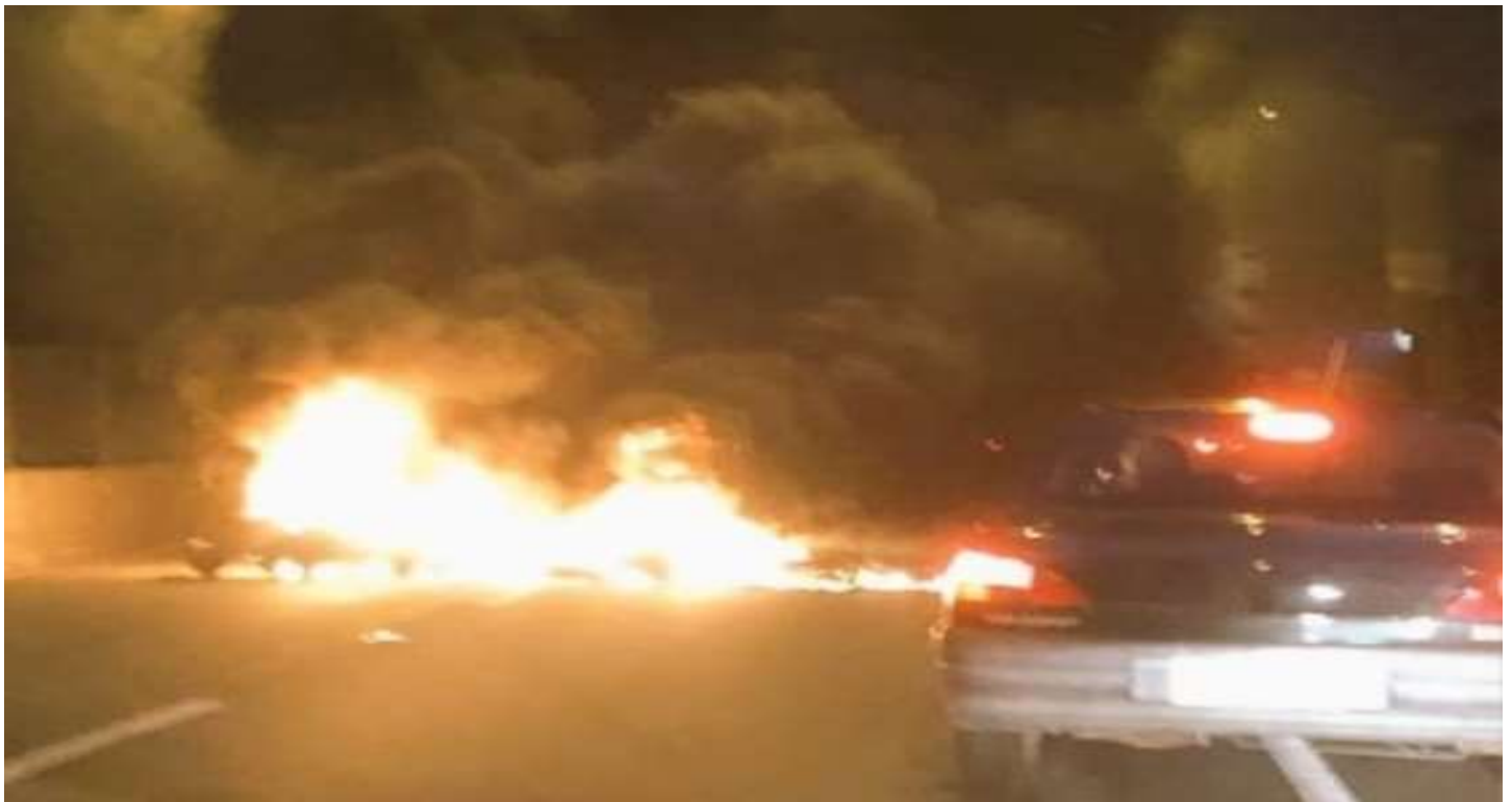
Viña del Mar