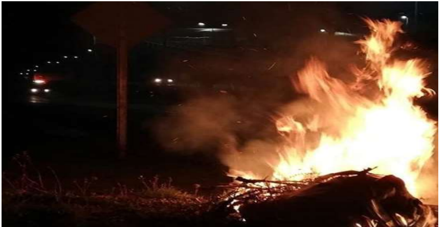
Padre Las Casas