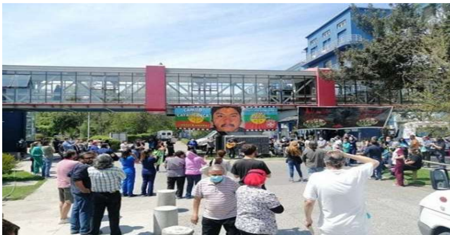
Hospital Sótero del Río (Puente Alto)