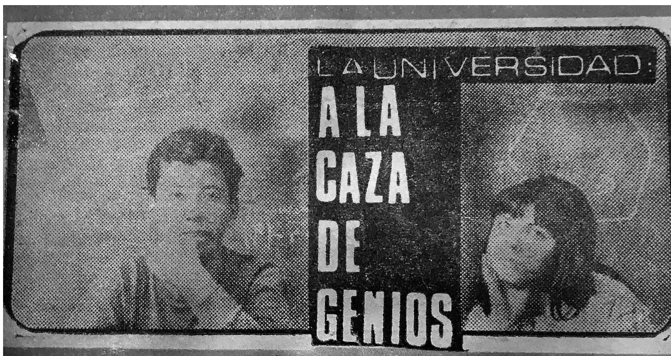
Suplemento dominical del diario El Siglo del 28 de enero de 1968.