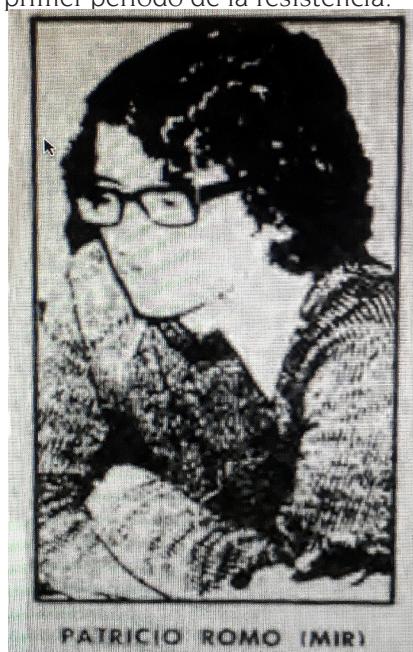
"Poder Popular, los Cordones Industriales y los Comandos Comunales". Revista Chile Hoy, del 10 al 16 de Agosto de 1973.