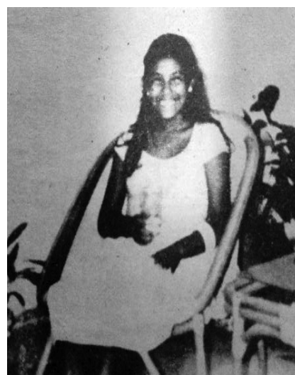
Su hija, que conoció a su padre solo por fotografías.