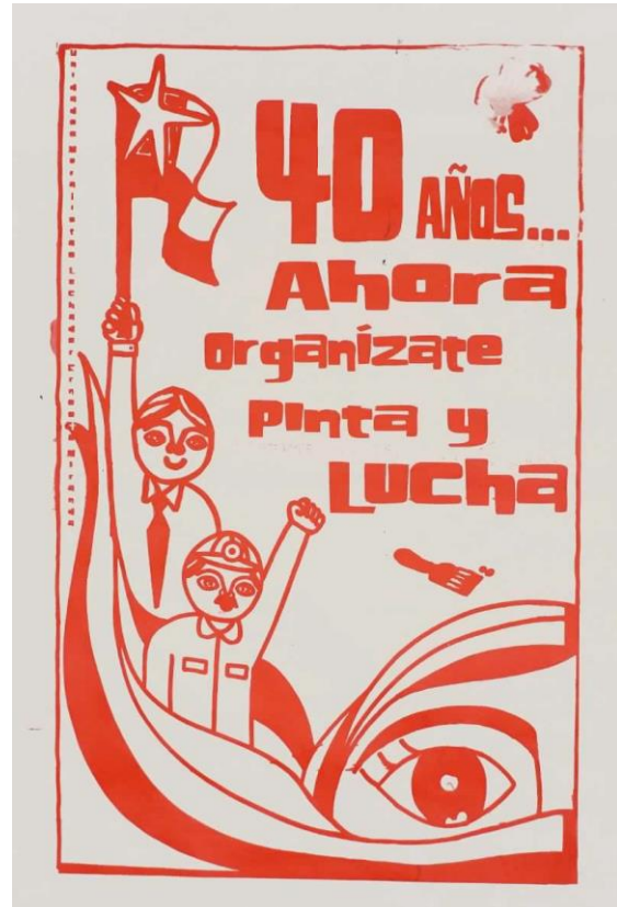
Unidades Muralistas Luchador Ernesto Miranda (2013) 40 años ... ahora organízate, pinta y lucha. [Serigrafía] Archivo Digital Londres 38, Santiago

El mensaje de la imagen 7 y 8 nos hablan por lado, de la intervención a las artes y oficios hace 40 años y de un retorno de las mismas en servicio a la revolución y el cambio social. La primera imagen se compone de cinco brazos en alto, que sostienen en sus manos herramientas como la brocha, el martillo, el lápiz y la gubia. Iconos que se repite en la imagen 8 donde se ve nuevamente la brocha, además de dos figuras humanas, los brazos en alto, la mano empuñada, una bandera y un trazo inferior que muestra la mitad de un rostro. Ambos afiches se relacionan con el arte y la lucha social. Las herramientas de la imagen 7 son propias del mundo de las artes y los oficios manuales, como la gubia para el tallado en madera. La posición de los brazos y la forma en que las manos sostienen los objetos simbolizan la lucha social al igual que la mano empuñada de la imagen 8. Los cuerpos de este último afiche, por la vestimenta que llevan, representan a un obrero y un estudiante, los que nos recuerda la unión obrero- estudiante propia de la Unidad Popular, mientras que el medio rostro del