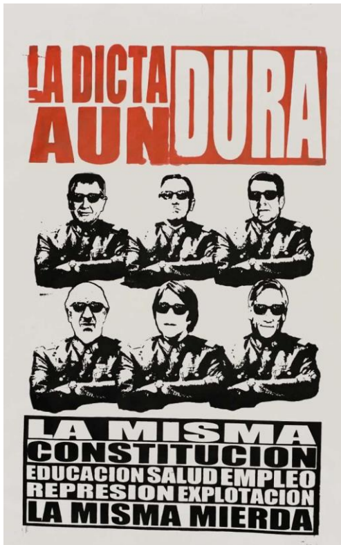
Periódico El Ciudadano (2013) La dictadura aún dura [Serigrafía] Archivo Digital Londres 38, Santiago