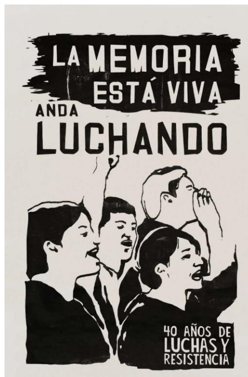
Londres 38, espacio de memorias (2013) La memoria está viva, anda luchando. [Serigrafía]

Tanto en la imagen 1 y 2 el mensaje es claro y preciso: para evitar el olvido, debemos luchar por y con la memoria, es decir, por el rescate de esta y utilizándola al mismo tiempo como arma de nuevas luchas sociales. En relación a los signos presentes, la primera imagen muestra una silueta antropomorfa, donde las palabras se insertan dentro la figura, cubriéndola por completo; en este sentido, la silueta sería un ícono de un cuerpo. Mientras que la segunda, se compone de cuatro figuras humanas, cuyas expresiones denotan gritos o exclamaciones que interpelan a un otro, tanto por las miradas como por los gestos realizados con las manos. Podemos ver también expresiones corporales como el puño en alto, representando la lucha social.