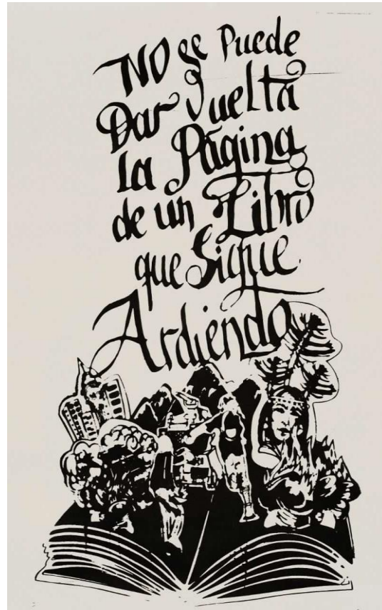
Colectivo Trópico (2013) No se puede dar vuelta la página de un libro que sigue ardiendo. [Serigrafía] Archivo Digital Londres 38, Santiago

La imagen 3 y 4 poseen mensajes en apariencia diferentes, pero se asemejan en el diseño iconográfico. La primera imagen expresa el retorno de la manifestación callejera después de 40 años de represión. Mientras que la segunda apela a la imposibilidad de avanzar, es decir, dar vuelta la página, si las heridas anteriores siguen vivas. La imagen 3 se compone de figuras humanas en conjunto, además de instrumentos musicales como guitarras, tambores, un saxofón, trompetas, un perro y un martillo. La imagen 4 por su parte, se compone de dos figuras humanas al centro y en la parte inferior de la imagen, mientras que al costado derecho se ve una mujer junto a dos araucarias, neumáticos y fuego. Al costado izquierdo se definen dos edificios, una torre, un carro policial y montañas de fondo. Todo lo anterior bajo un libro abierto.