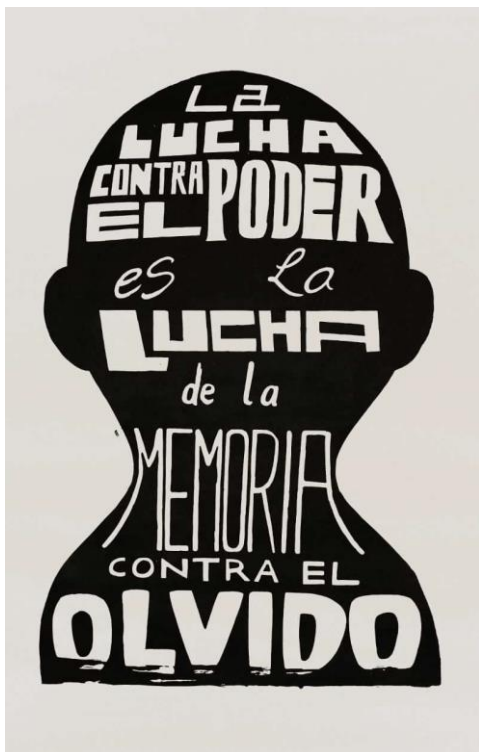
Rufián Revista (2013) La lucha contra el poder es la lucha de la memoria contra el olvido. [Serigrafía]