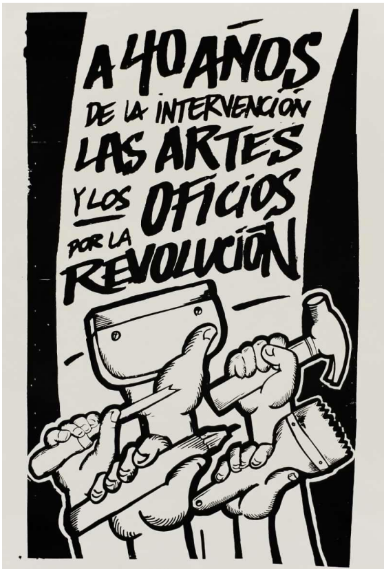
Serigrafía Instantánea (2013). A 40 años de la intervención, las artes y oficios por la revolución.[Serigrafía] Archivo Digital Londres 38, Santiago